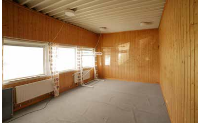
Kontoren har fönster som vetter österut mot E4. (2 rum). Ett kontor med fönster norrut.