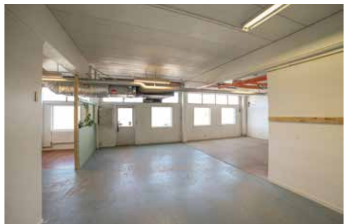
Fönstren i lokalerna vetter norrut, mot busshållplats