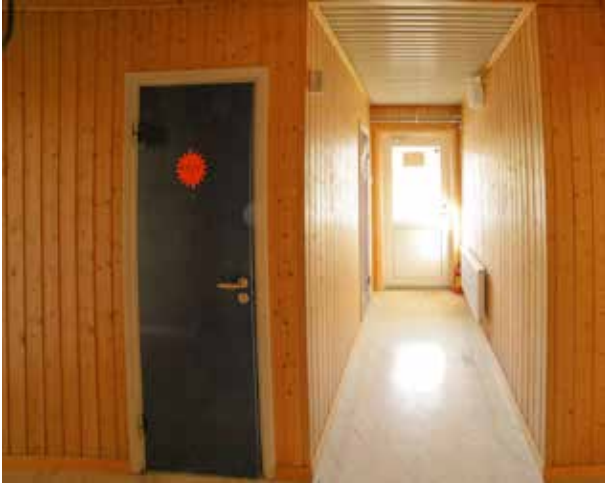
Korridor, toa med utgång mot E4 mellan kontorsrum.

på 124 m 2 , går att dela på två till tre mindre kontor