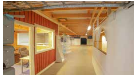
Kontor t.v. samt lokal A+B

682 m 2 - delat i tre lokaler med olika bärighet på golv. (Tidigare Peders Möblers försäljningsdel)