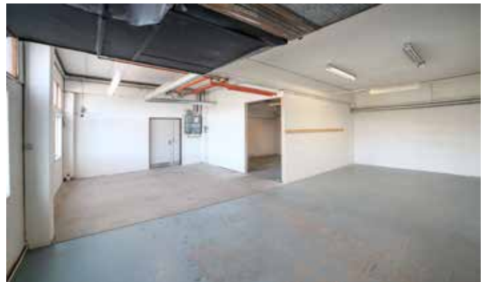
Kontor till vänster, butikslokal/verksamhetslokal till höger. Fönstren vetter mot busshållplats