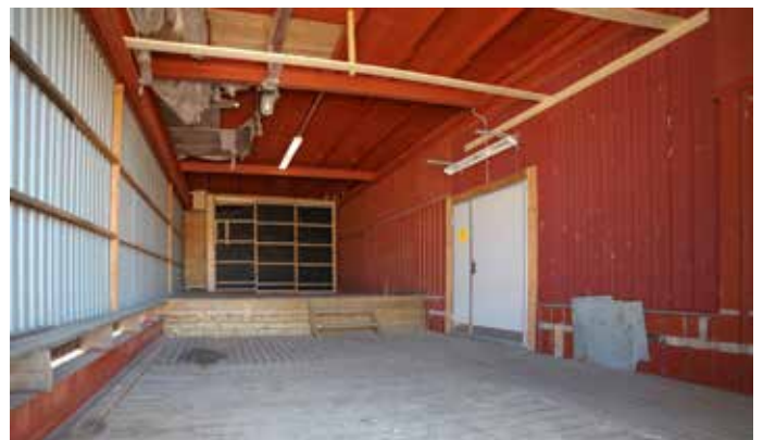
Direkt i anslutning till lastbryggan med låg lasthöjd